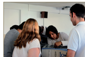
CFGS Desarrollo de Aplicaciones Multiplataforma (IFCS02)