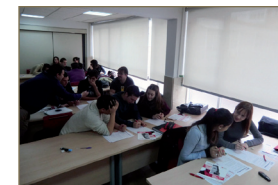
CFGS Gestión Comercial y Marketing (COM302)