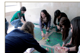
CFGS Educación Infantil (SSCS01)