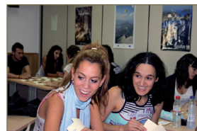
CFGS Agencias de Viajes y Gestión de Eventos (HOTS02)