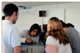
CFGS Administración de Sistemas Informáticos en Red (IFCS01)

(HORARIO: mañanas de 8 h. a 14 h. y tardes de 15 h. a 21 h.)