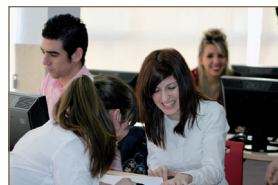
CFGS Administración y Finanzas (ADGS02)